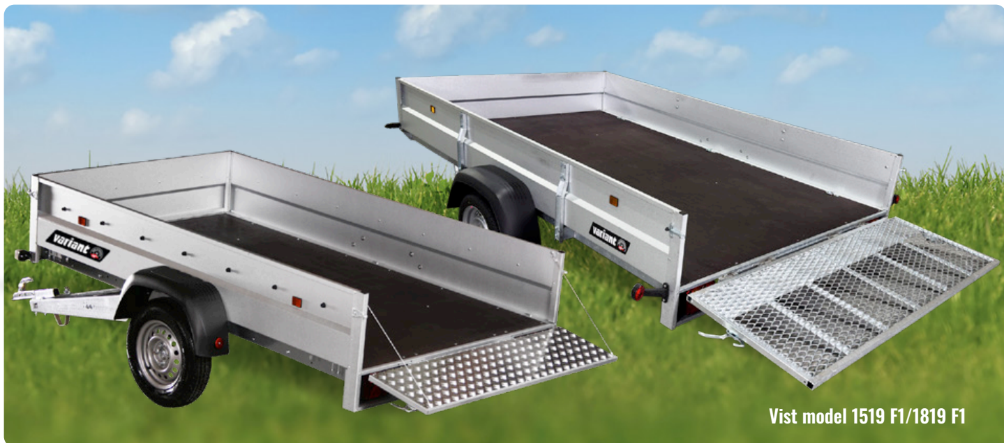
Vist model 1519 F1/1819 F1